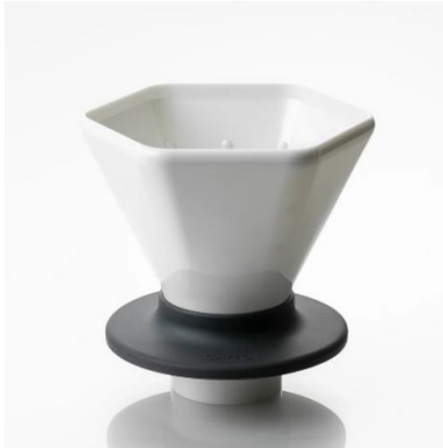
フラワードリッパーDEEP45 (2024年発売)